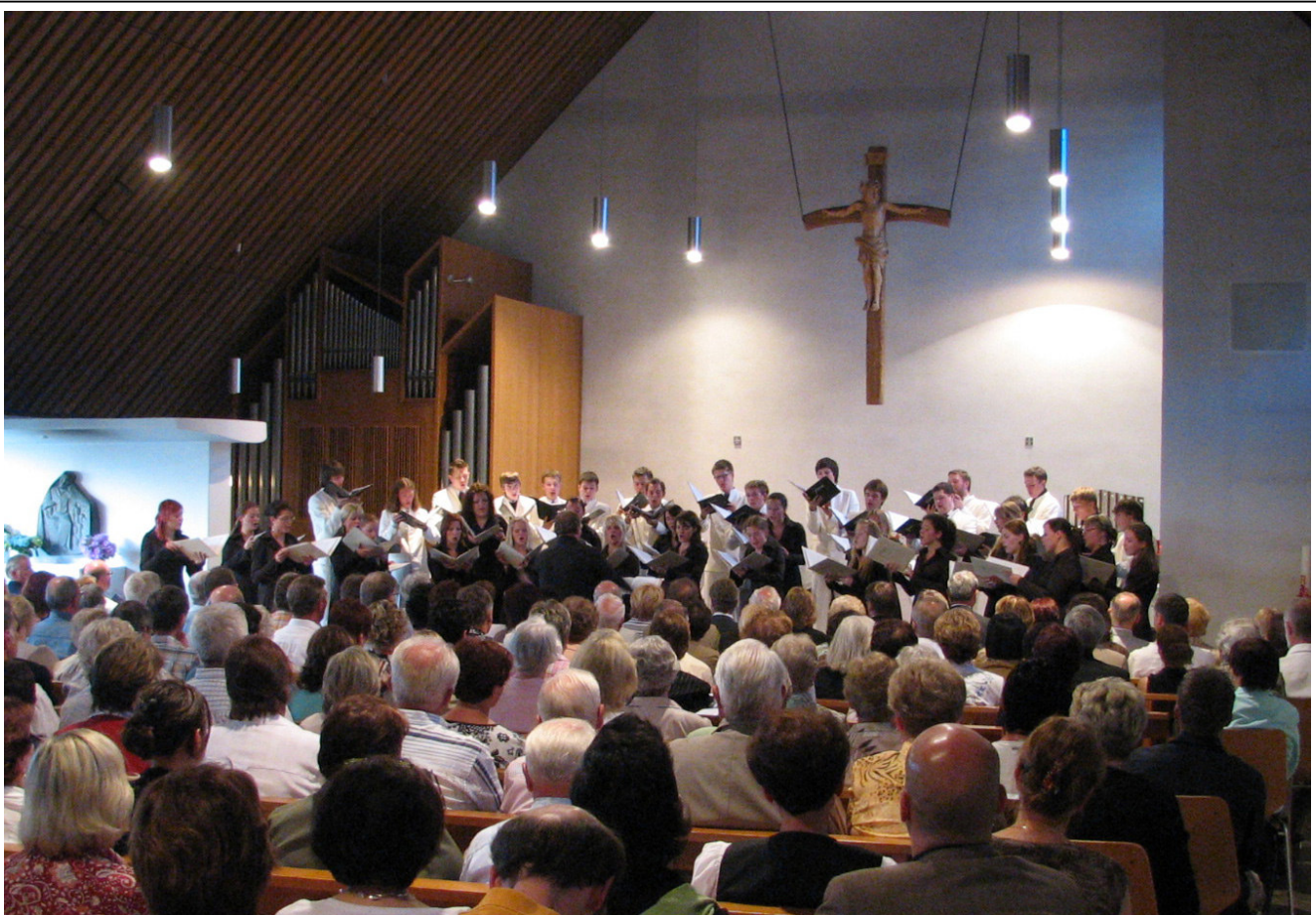
Ein vollbesetztes Gotteshaus lauscht andachtig dem Chor „Kamer...“ zu.

Stucke schlugen die Zuhorer in ihren Bann. Der Hohepunkt war zweifelsohne das Stuck „A drop in the ocean“, in Gedenken an Mutter Theresa. Die optische Kronung dazu war ein weies Seidentuch mit einem uberdimensionalen Abbild von Mutter Theresa, welches der Chor zum Schluss des Stuckes uber sich zog. Nach funf Zugaben war eines gewiss: So etwas hatte man in Staudt noch nicht erlebt, und wurde es auch so schnell nicht mehr. Nach dem Konzert suchten selbst junge Menschen nach Worten fur das, was sie da soeben erlebt hatten. Aber manchmal bedarf es auch keiner Worte, allein das Erlebte zahlt. Was bleibt ist die Erinnerung an einen unvergesslichen Abend, wo man stolz und glucklich sein