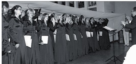
Wann tritt schon mal ein „Erster der Weltrangliste“ im Westerwald auf? Einen solchen Höhepunkt gab es nun in der Staudter Kirche, wo der Lettische Chor „Kamer“ einen Konzertabend gestaltete, der in unserer Region seinesgleichen suchen muss.

schen Fäden der Chorbegleitung um den Gesang der Solisten ein gläsernes Netz aus filigranen Tönen spannte. Einfach traumhaft schön. Nicht minder bewegend zwischen all den Glanzlichtern des Abends „Der Tropfen im Ozean im Gedenken an Mutter Theresa“. Dieser beinahe unwirkliche Gesang ließ nicht nur in die Augen gestandener Mannsbilder Tränen der Ergriffenheit treten.