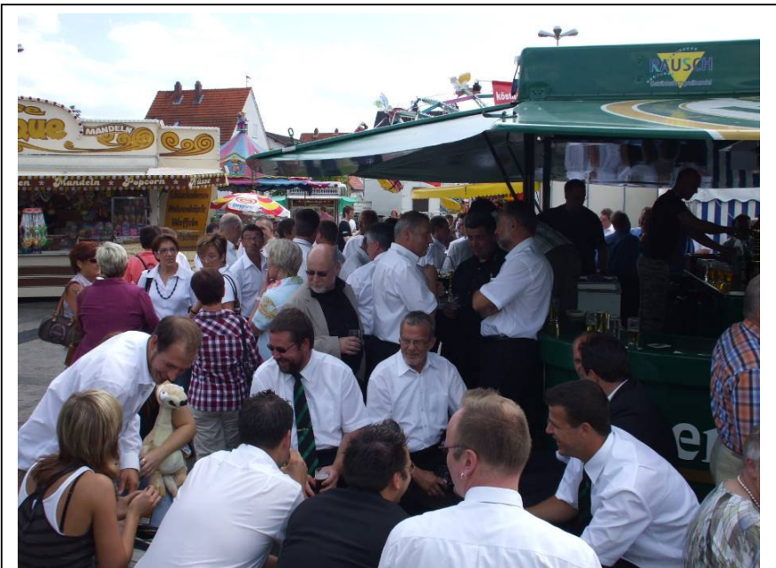
Der Spaß kam nicht zu kurz. Es wurde gesungen und gelacht!

Diesen verbrachten die jüngeren Sänger, also alle unter 60 und Keil Edi gemeinsam mit unseren Gästen von der Kirmesjugend auf dem Festplatz vor der Halle. Nach einigen Körbchen Bier wurde die Runde immer größer und die Stimmung immer fröhlicher. Aus anfangs zwei Bänken wurden vier und bald hatten wir mitten in Hüttenberg eine kleine Staudter Kolonie gebildet. Alles für die Jugend, aber wir haben es doch gerne getan, oder? So verging die Zeit bis zur Bekanntgabe der Ergebnisse wie im Flug und um 18.00 Uhr gingen wir zusammen in die große Halle, wo in der Regel der TV Hüttenberg Handball spielt. Wir setzten uns auf die Zuschauerränge und hatten somit einen schönen Ausblick von oben. Dann kam der Moment, dem alle entgegengefiebert hatten: Die Punktevergabe. und nach einigen endlos erscheinenden Minuten war es dann Gewissheit. Wir hatten in der Klasse M2b alle ersten Preise und somit ein Goldenes Diplom errungen. Außerdem konnte sich unser Chorleiter über den ersten Dirigentenpreis