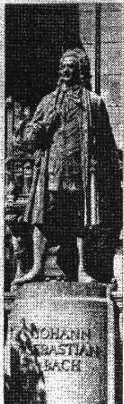
Bach-Denkmal vor der Thomas-Kirche in Leipzig

Johann Sebastian Bach (1685-1750) war einer der bedeutendsten Vertreter des Spätbarock.