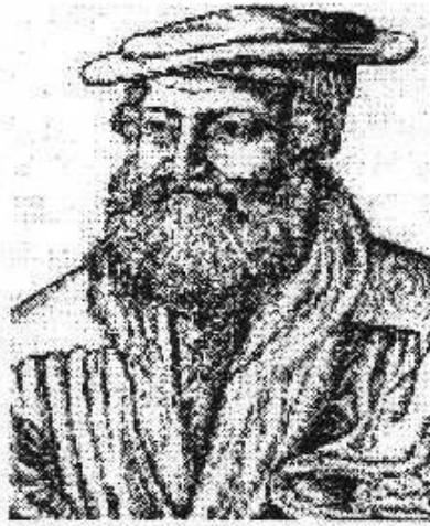
Meistersinger Hans Sachs (1494—1576)

Die Melodie kommt in vielen alten Liedersammlungen vor. In der Schweiz wurde 1558 ein Frühlingslied auf die Reformation gedruckt, das so beginnt: Wach uf, mins herzen schöni, du christliche schar . Auch Marienlieder wurden auf die gleiche Melodie gesungen.